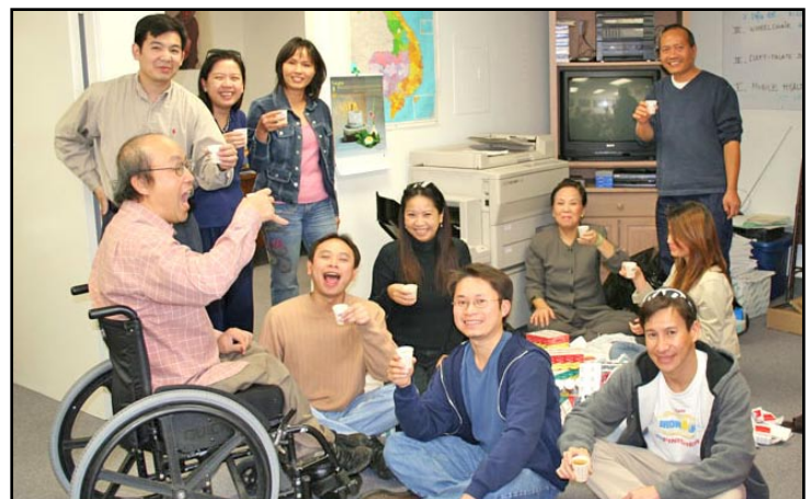
Cheers for the New Year!!! Chúc Mừng Năm Mới!!!