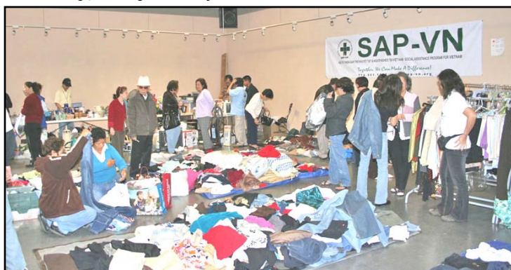
Quang cảnh chợ Garage Sale SAP-VN & HopeToday 2/08