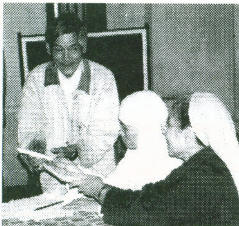
Phối hợp với 2 phòng khám Kim Long và Diệu Để phát tiền ở Phú Vang, Thừa Thiên Huế.

ĐT. & Fax (714) 901-1997 thứ hai đến thứ sáu từ 4:30 - 6:00 giờ chiều, thứ bảy từ 10:00 - 6:00 giờ chiều. . (Email: info@sap-vn.org)